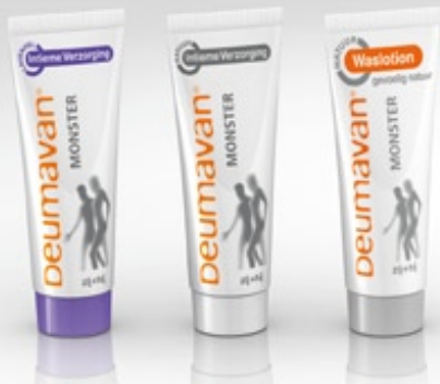
Monstertube zalf met lavendel