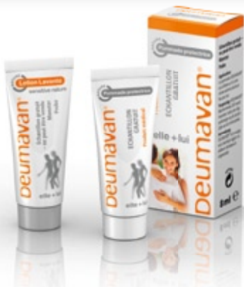
Echantillon gratuit Lotion Lavante nature