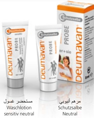
مستحضر غسول Waschlotion sensitiv neutral